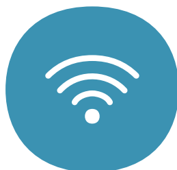
Inkluderet trådløs router med god wi-fi dækning